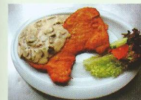
Champignon- oder Paprikarahmschnitzel € 8,10